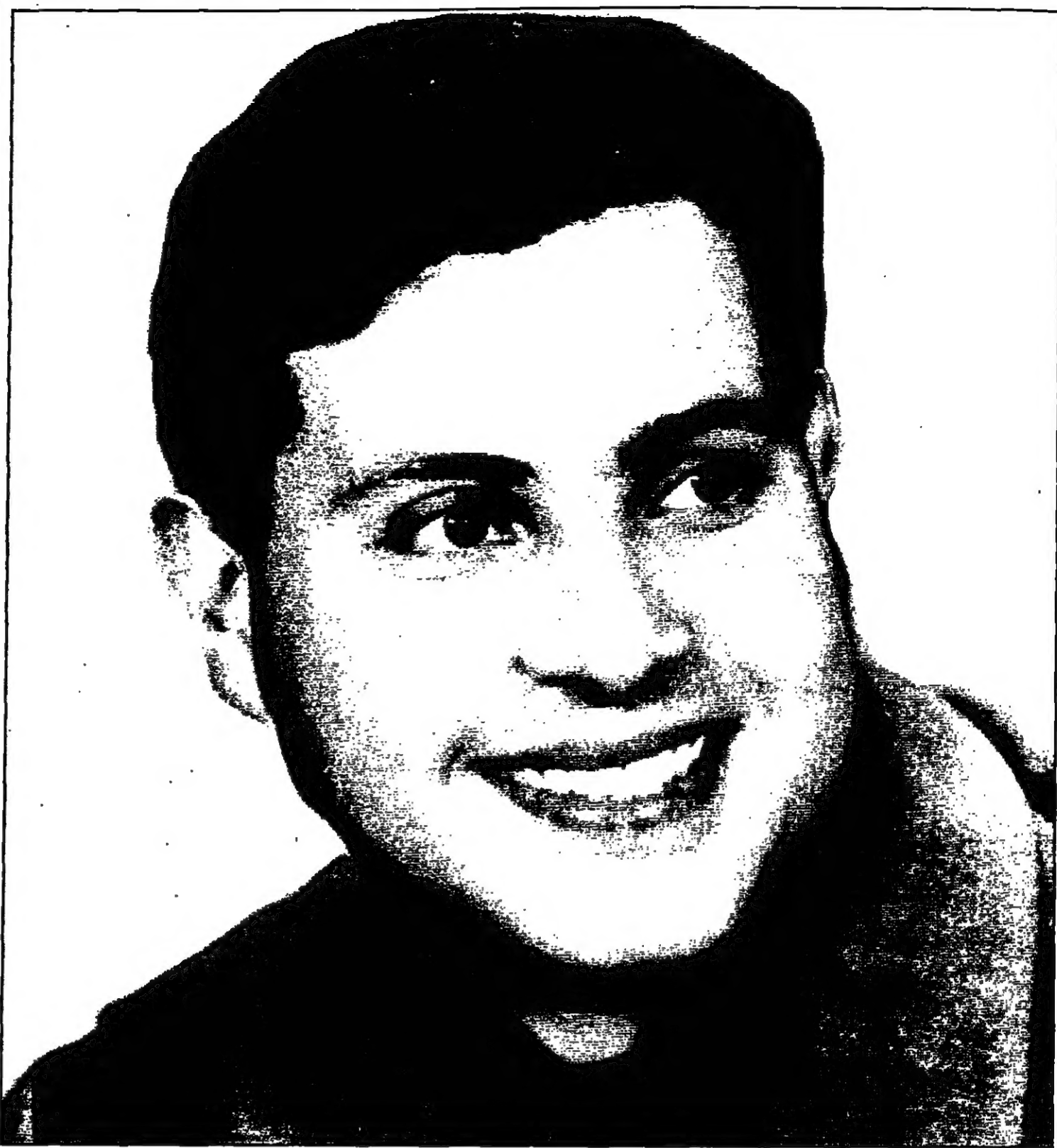
هاني شاكر (القديس العربي)